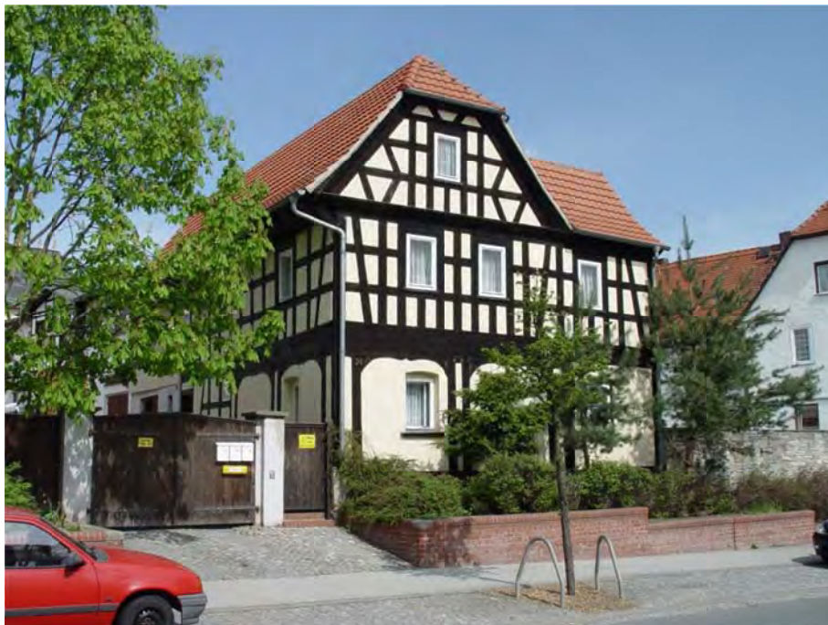
Die heutige Alte Regensburger Straße 24 (ursprünglich 2 und letzte Geleiteinnahmestelle)

„Ursprünglich als Schutzdienst war das Geleit gedacht gewesen. Diese eigentlich zu Anfang den Handel fördernde und sichernde Einrichtung wandelten die Feudalherren zu einer recht ergiebigen Einnahmequelle um. Sie errichteten an allen Durchgangsstellen durch ihr Herrschaftsgebiet ihre „Geleiteinnahmestellen“. Die Kaufleute wurden gezwungen, auf ganz bestimmten „Geleitstraßen“ zu fahren, deren Benutzung nur gestattet war, wenn für die auf diesen Straßen beförderten Waren ein besonderes Geleitgeld“ bezahlt wurde.“ [Festschrift zu 700-Jahr-Feier von Hermsdorf 1956]