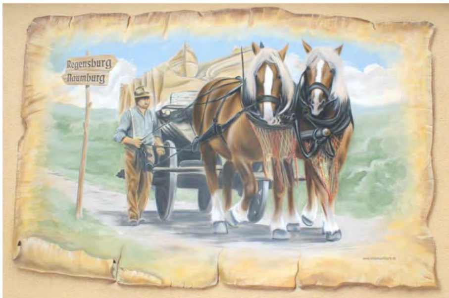
Darstellungen des Fuhrmannswesens in der Hermsdorfer Geschichte.

Besonders auf die Fuhrleute hatten es die Räuber in der Vergangenheit abgesehen. Ziel ihrer Raubzüge waren die mitgeführten Waren, besonders aber auch die Taler.