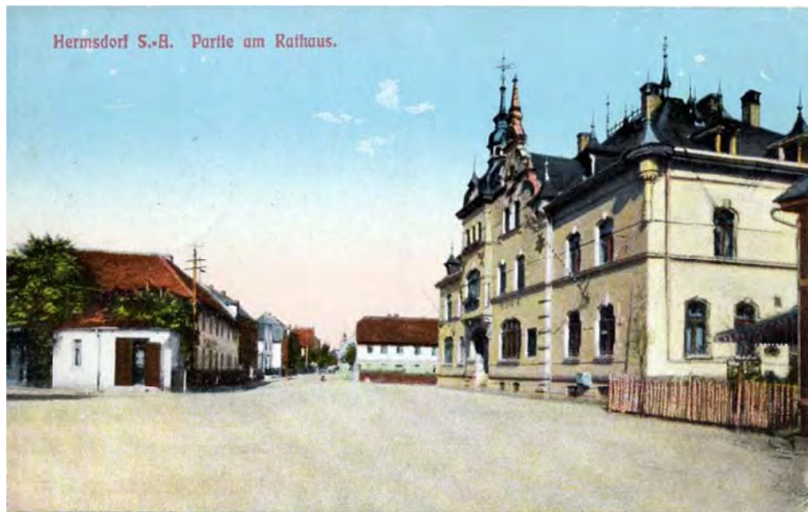
Rathaus Hermsdorf rechts, Gaststätte „Zur Quelle“ links. In dem Haus (heute Parkplatz) befand sich eine Geleiteinnahmestelle.

Angehörige des niederen Adels (Raubritter) achteten das freie Geleit auf den Straßen nicht und vergingen sich am Eigentum der reisenden Kaufleute. Diese suchten deshalb Schutz durch begleitende Reiter und Männer, die vom Landesherrn zur Verfügung gestellt wurden. Für diesen Schutzdienst - das Geleit - mussten die Kaufleute nun „Schutzgeld“, auch „Geleitgeld“ oder „Chausseegeld“ genannt, bezahlen.