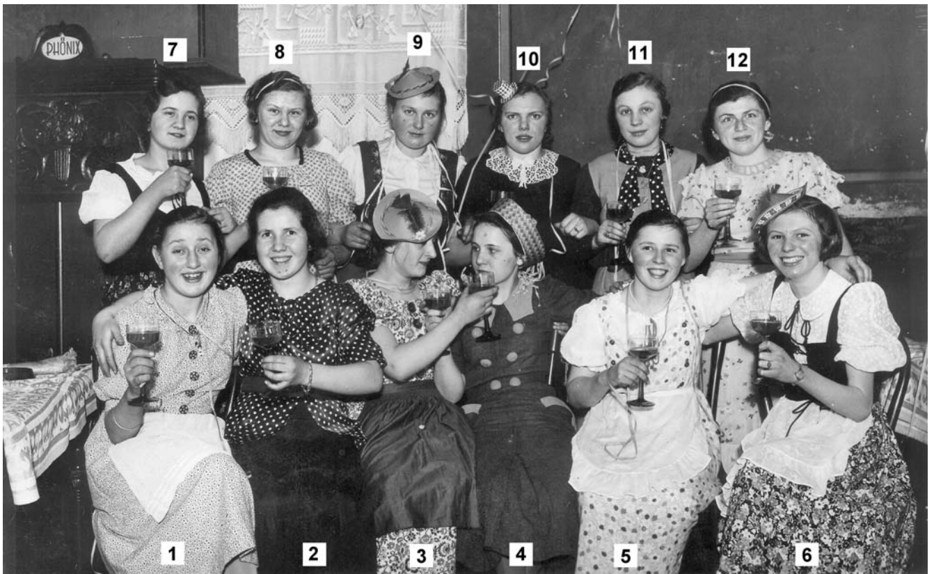
Abschlussfeier der Hauswirtschaftsklasse in der Berufsschule Hermsdorf am 13.03.1937