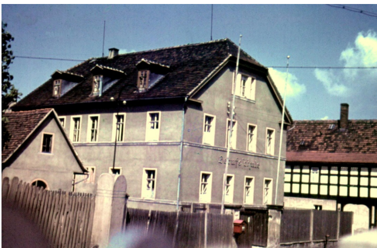
Die GBS Hermsdorf im Jahr 1943

Am 01.04.1944 stellte das Arbeitsamt in Hermsdorf noch die neuen Lehrlinge für den Lehrbeginn September ein. Beim Brandbombenangriff vom 09.04.1945 erlitt die Berufsschule keinerlei Beschädigungen, während das angrenzende Sägewerk Kraft und das gegenüberliegende Peuckertsche Grundstück völlig durch Brandbomben vernichtet wurden. Am 13.04.1945, mit dem Einmarsch der amerikanischen Truppen in Hermsdorf endete die Geschichte der BS vorerst für kurze Zeit..